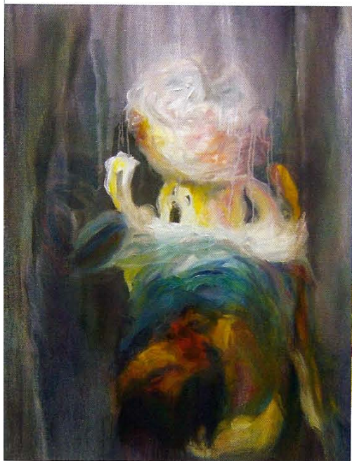
Claire Deniau Figure de fantaisie 2009 Huile sur lin 81 x 65 cm