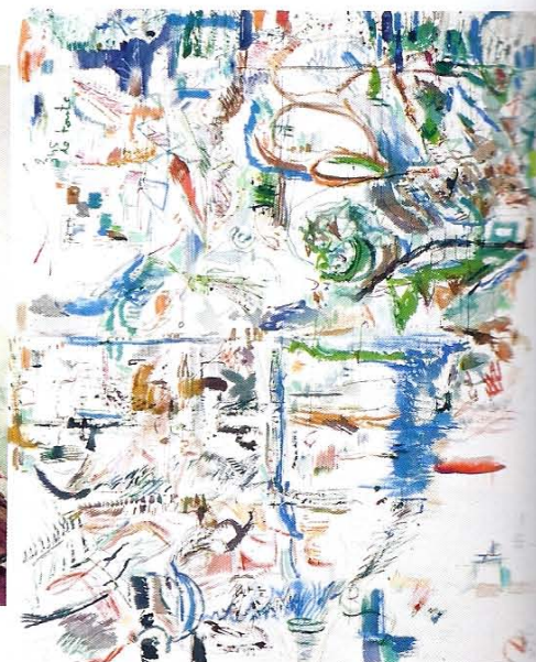
Guillaume Lebel De toute 2008 Gouache sur toile 189 x 165 cm

MondapArt 50-52, boulevard de la République 92100 Boulogne Billancourt www.mondapart.com Jusqu'au 10 janvier 2010